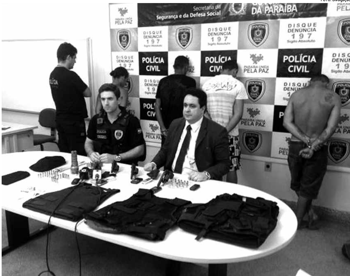
A Polícia Civil apresentou os presos, armas, munições e pedras de crack que foram apreendidas durante a Operação Mangue Seco