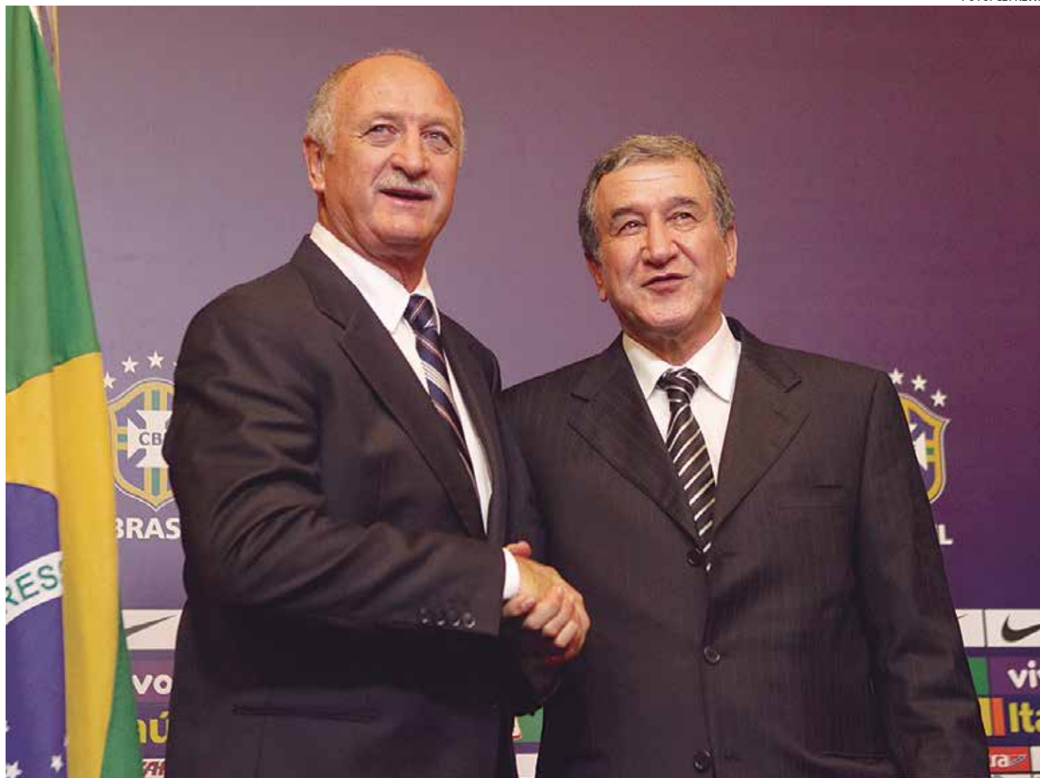
Amigos de longas datas, Felipão e Carlos Alberto Parreira voltam a assumir o comando da Seleção Brasileira de Futebol

A frase de Parreira foi menos enfática, mas com o mesmo sentido. O treinador ainda exaltou suas experiências anteriores em Mundiais: quatro com a Seleção Brasileira, uma com o Kuwait, outra com os Emirados Árabes Unidos, mais uma com a Arábia Saudita e a mais recente com a África do Sul. “É uma honra disputar uma quinta Copa do Mundo. Isso é para poucos. Me sinto como um garoto. E é um prazer reviver uma dobradinha, como aquela com o Zagallo, que deu certo”, discursou o carioca.