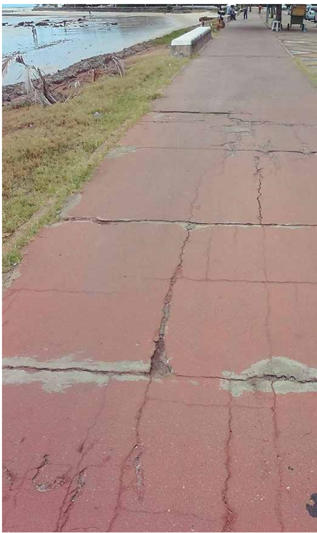
Problemas de pavimentação no calçadão chamam a atenção na orla da Praia de Cabo Branco

O principal intuito do projeto "Prazo de Validade Vencido" é fazer com que os órgãos (a nível federal, estadual e municipal) passem a fazer uma inspeção nas obras e que haja uma verba específica destinada para sua manutenção. A realização da vistoria deve ser rotineira, devendo ser realizada em um intervalo de tempo regular, não superior a um ano. Deve-se, também, definir um programa permanente de manutenção e desenvolver o cadastro das pontes e viadutos, com dados quantitativos e históricos. Uma possível solução seria reservar, na própria licitação da obra, 1% do seu valor para ser gasto com sua manutenção, anualmente, como já acontece em outros países.