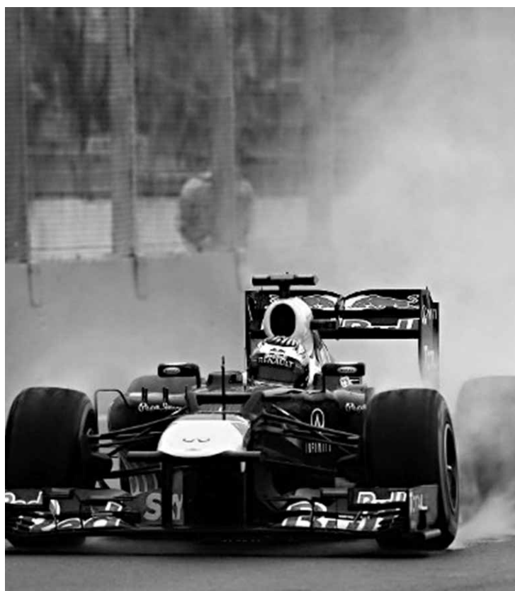
O alemão da RBR fez as ultrapassagens dentro do regulamento

À publicação inglesa “Autosport”, a FIA confirmou que não houve irregularidades na ultrapassagem. O setor