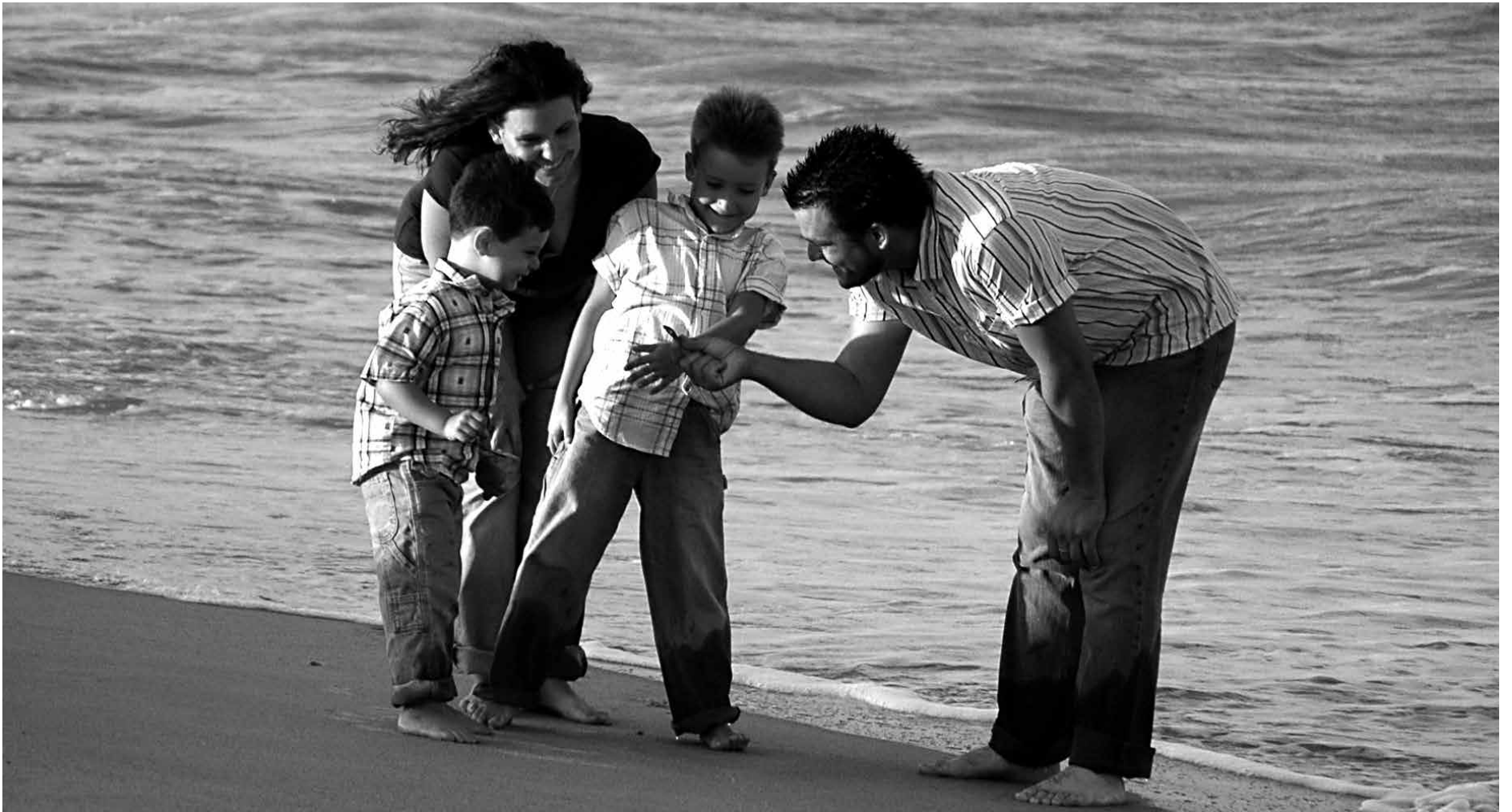
Número de famílias, em 2011, era de 64,3 milhões e ostentavam uma média de três pessoas; houve um aumento de 18,8% para 21,7% na proporção de casais sem filhos