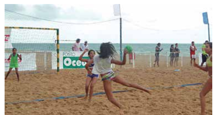
As disputas vão acontecer na Praia do Cabo Branco em janeiro

As inscrições para a Taça Kika podem ser feitas até o dia 4 de janeiro. A taxa de inscrição é de R$ 200 por equipe. O congresso técnico, onde serão discutidos detalhes do evento, está marcado para o dia 10 de janeiro. Os interessados em participar da com-