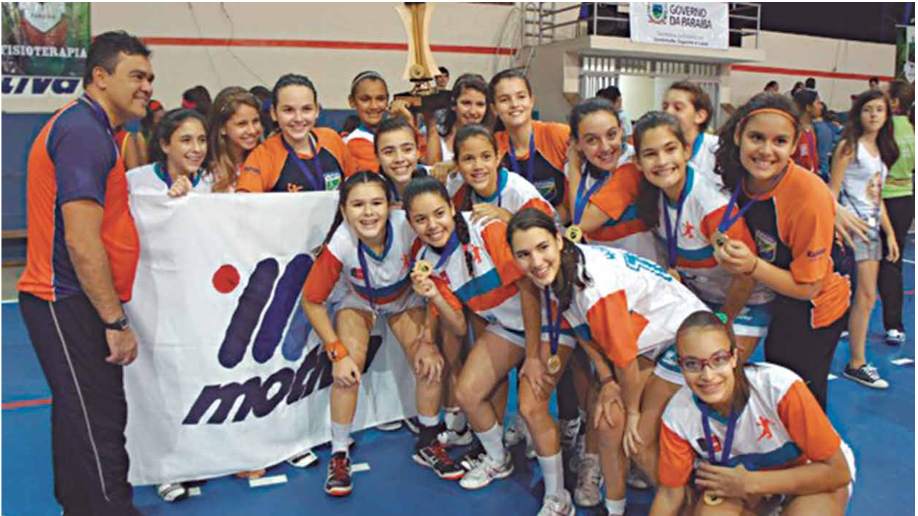
A equipe do Colégio Motiva, da Paraíba, representa o Brasil nos Jogos Sul-Americanos Escolares que estão sendo realizados em Natal e vão até a próxima semana

O maior evento esportivo escolar das Américas reunirá cerca de 2.500 atletas de 12 países, com faixa etária entre 12 e 14 anos.