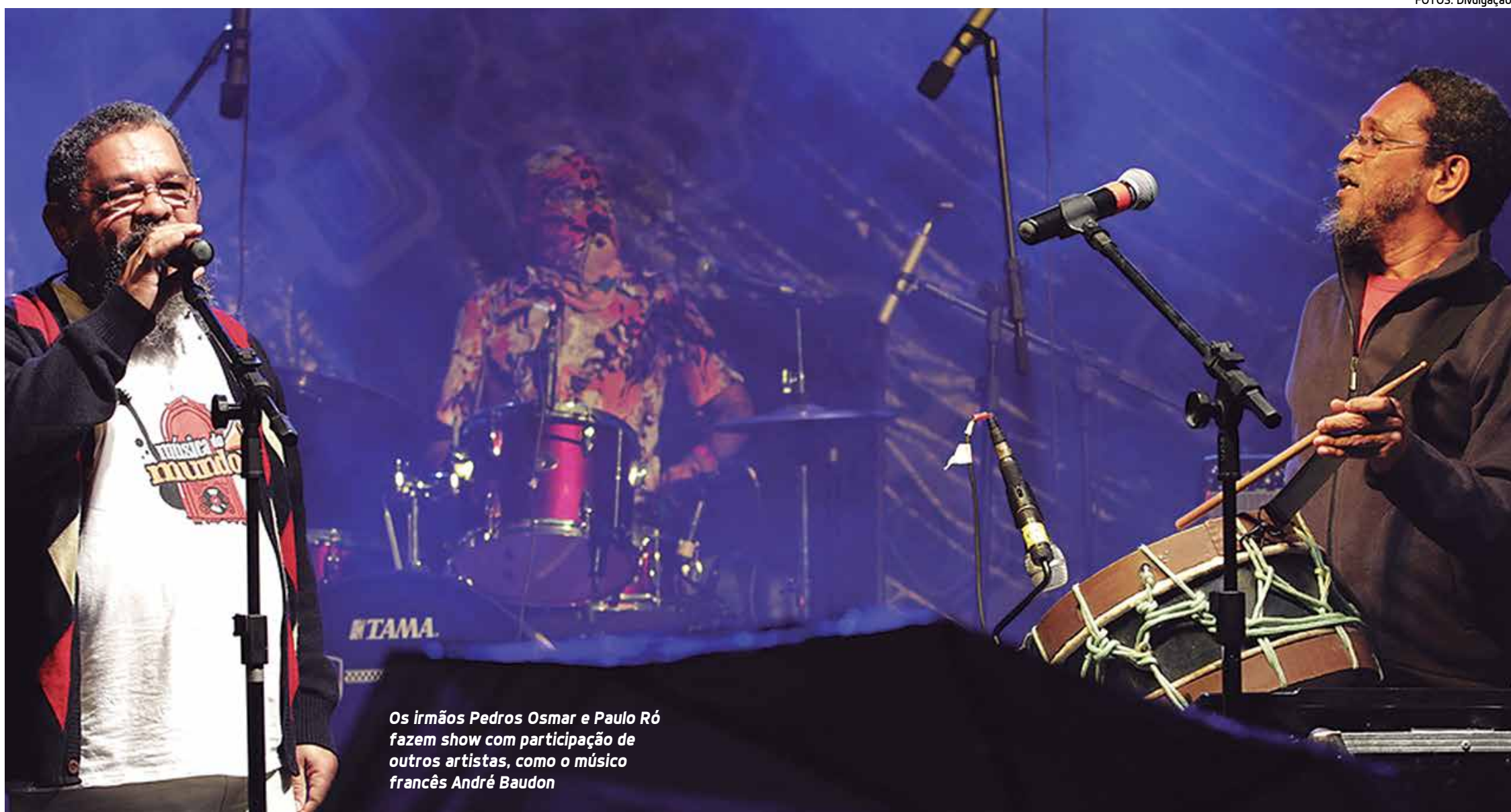
Os irmãos Pedros Osmar e Paulo Ró fazem show com participação de outros artistas, como o músico francês André Baudon