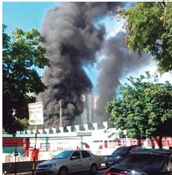
As consequências do incêndio ainda estão sendo levantadas

Ao ser questionado sobre as possíveis causas do incêndio, o dirigente disse que ainda não é possível saber exatamente o que aconteceu.