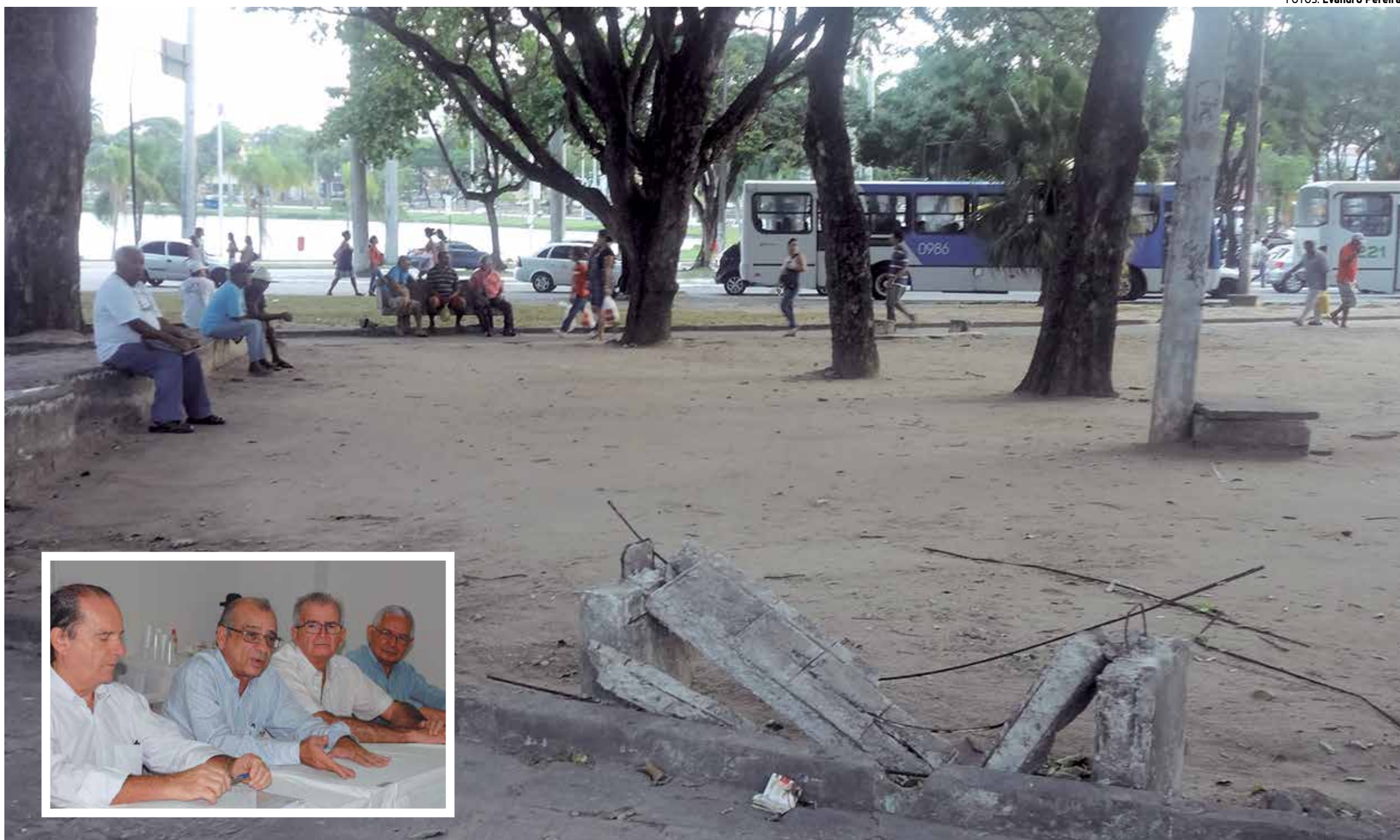
Técnicos e engenheiros do Sindicato de Arquitetura e Engenharia vistoriaram 50 pontos na cidade, entre eles o Parque Solon de Lucena, que sofre com a ação de vândalos e falta de manutenção